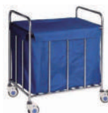
SKU: EPUF1400 Carro transporte ropa sucia. Estructura acero inox. Ruedas. Lona ultra resistente con tapa. Medidas 80 x 53 x 90 cm