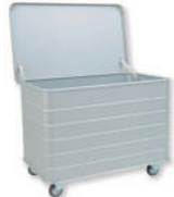
SKU: AV3350CR Carro ropa sucia de aluminio. Capacidad 366 lts. Medidas 105 x 65 x 80 cm