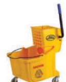
SKU: PCJWMP32 Carro estrujador de mopas. Capacidad 32 lts. Plástico. Color amarillo.