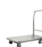
SKU: KAST110515 Carro plataforma. Acero inox. Medidas 90 x 55 x 93 cm