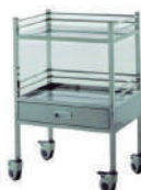
SKU: EPUF2100 Carro curaciones. Estructura acero inoxidable. 2 niveles. 1 cajón. Medidas 64 x 45 x 99 cm