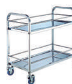
SKU: KAST110151 Carro utilitario / apoyo / curaciones. Acero inox. 2 niveles c/barra antivuelco. Medidas 95 x 50 x 95 cm