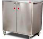
SKU: CME10467 Carro transporte ropa sucia. Acero inoxidable, con repisa intermedia. Medidas 104 x 67 x 95 cm. Capacidad 6 STU