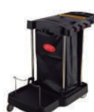
SKU: PCJWCCSS Carro aseo y limpieza con bolsa y porta estrujador. Capacidad bolsa 72 litros. Capacidad balde 9 litros. Con 4 ruedas móviles y 2 de ellas con freno.