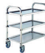
SKU: KAST110140 Carro utilitario / apoyo / curaciones. Acero inox. 3 niveles. Medidas 85 x 45 x 90 cm