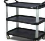
SKU: PCJWSEDO Carro apoyo / curaciones / utilitario. Estructura polímero y aluminio. 3 niveles. Medidas 98 x 53 x 93 cm