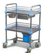
SKU: EPUF1700 Carro curaciones. Estructura acero inox. 2 niveles c/ barra antivuelco. Cajón. Bowl y basurero desplazables. Medidas 66 x 47 x 97 cm