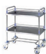
SKU: EPUF1900 Carro curaciones. Estructura acero inox. 2 niveles c/ barra antivuelco. Medidas 73 x 47 x 97 cm