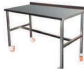
SKU: MA120601 Mesa arsenalera acero inoxidable con ruedas. Medidas 120 x 60 x 85 cm