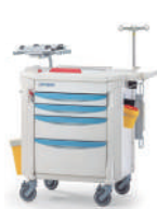
SKU: EPUF4700 Carro paro y emergencia. Estructura acero y abs. Ruedas con freno. 4 cajones con cierre centralizado. Porta desfibrilador y suero. Tabla RCP. Medidas 97 x 56 x 98 cm