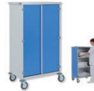
SKU: AV4000CR Carro ropa limpia de aluminio con puertas. Capacidad 390 lts. Medidas 82 x 54 x 140 cm