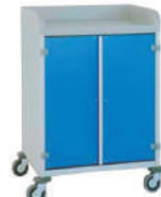
SKU: AV3950CR Carro ropa limpia de aluminio con puertas. Capacidad 210 lts. Medidas 74 x 54 x 100 cm