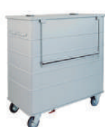
SKU: AV4500CR Carro ropa sucia de aluminio. Capacidad 1000 lts. Medidas 140 x 76 x 136 cm