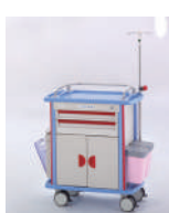
SKU: EPUF4520 Carro emergencia y curaciones. Estructura acero y abs. Tabla RCP. 2 cajones ajustables. 2 plás. Medidas 82 x 51 x 98 cm