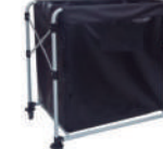
SKU: PCJWXC300 Carro aseo plegable. Estructura acero con pintura epóxica con ruedas, con bolsa de vinilo resistente. Medidas 89 x 66 x 86 cm. 300 litros.